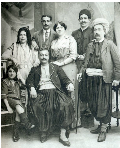
Quatre générations de Juifs d'Algérie. Dès avant 1914, port de vêtements occidentaux

« Citoyen français ou israélite indigène : les Juifs d'Algérie et la loi du 7 octobre 1940 »